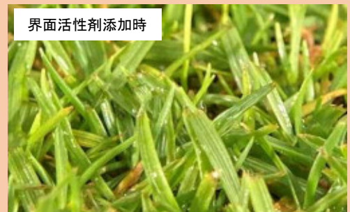
界面活性剤添加時