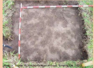
界面活性剤(土壌浸透剤)を添加することで、肥料ムラや農薬の効果ムラの原因になる土壌中の水ムラを予防・改善できる